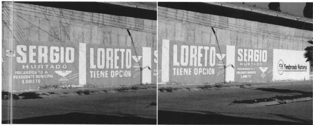
Ubicación: Calle Niños Héroes cruce con Gral. Felipe Ángeles, Colonia el Edén, Loreto, Zac.