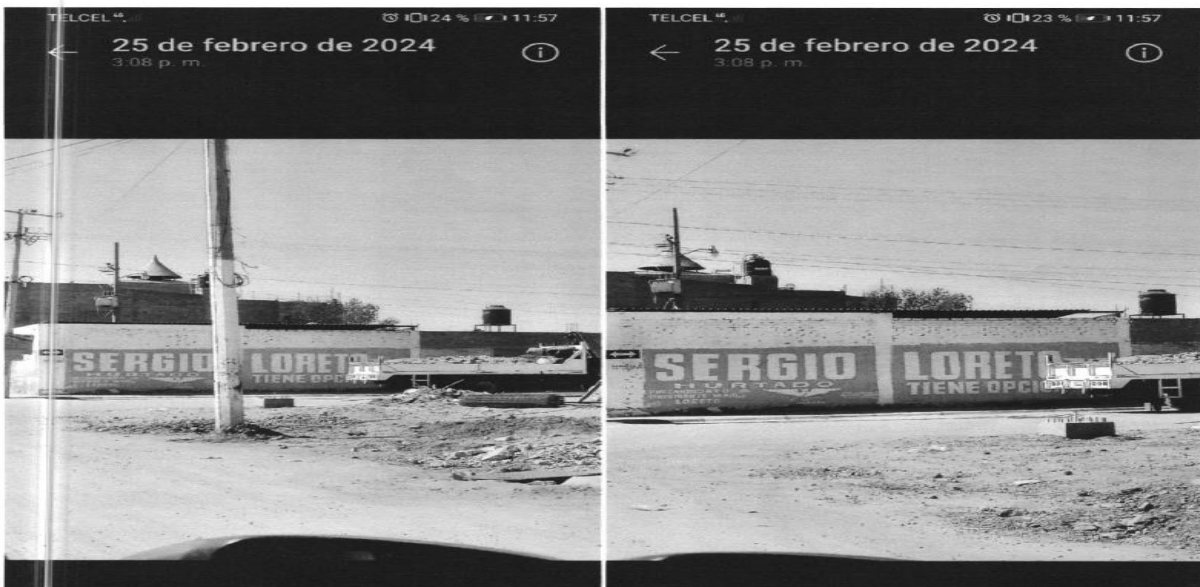
Ubicación: Av. Gregorio Torres Quintero cruce con calle Batalla de Zacatecas Col. San Marcos II, Loreto, Zac.

De las imágenes insertas, sacadas del expediente, se advierte que la denuncia reúne los cinco requisitos precisado en el numeral señalado; es decir, nombre del quejoso y firma autógrafa; domicilio para oír y recibir notificaciones; el documento con el que acredita su personería, la narración de los hechos base de su denuncia, y ofreció pruebas. Por lo que, al no existir prueba en contrario que justifique que no es así, se estima infundada la causal de improcedencia que hace valer el partido denunciado.