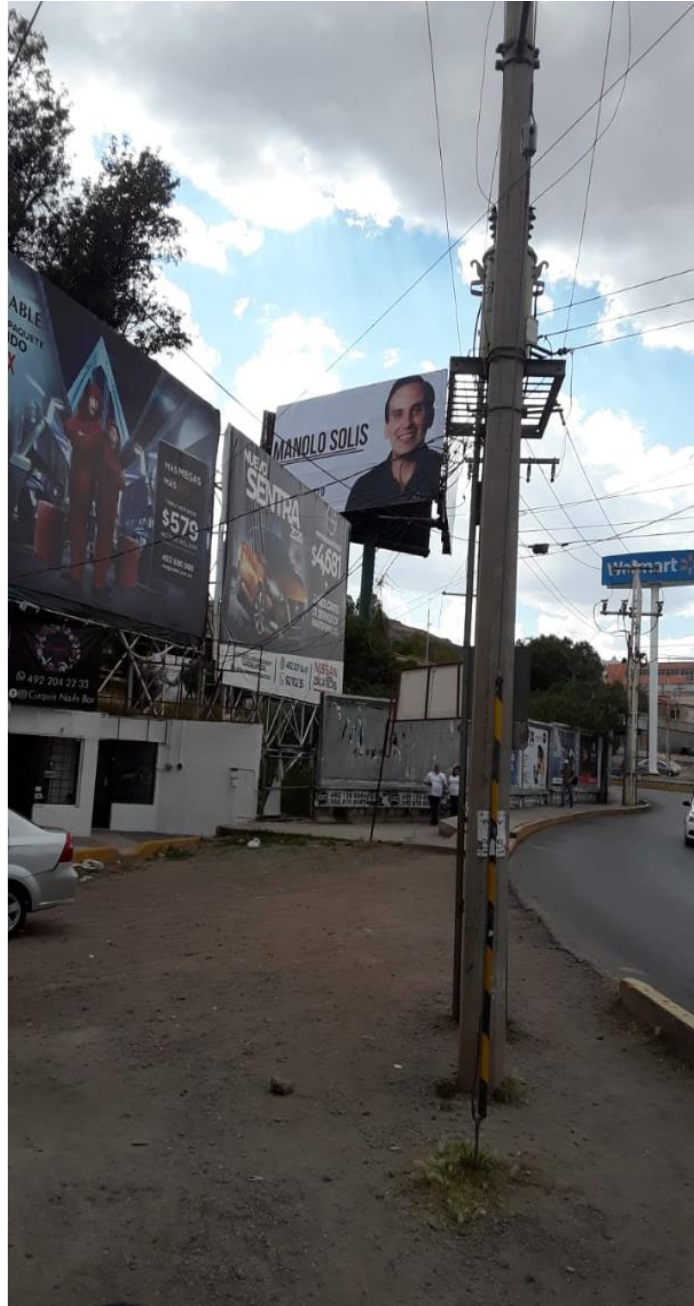
Ubicación: Paseo García Salinas, esquina con Avenida López Portillo, en la ciudad de Zacatecas.